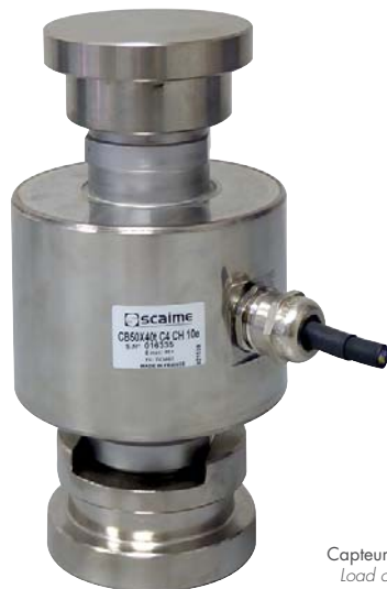
Capteur vendu séparément Load cell sold separately