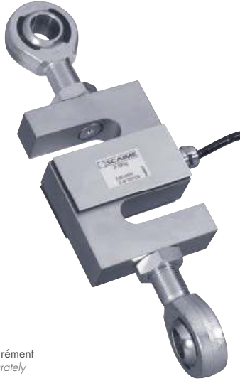
Capteur vendu séparément Load cell sold separately