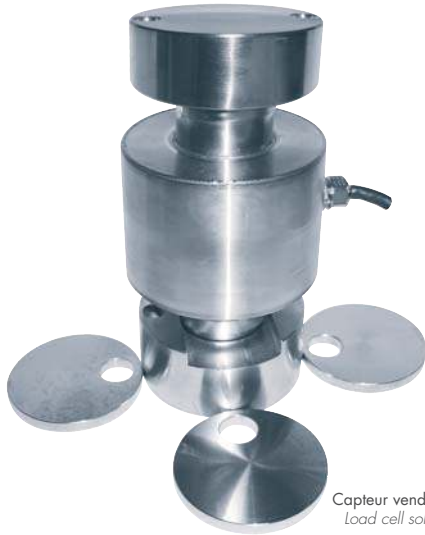
Capteur vendu séparément Load cell sold separately