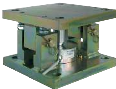
Kit de montage SILOSAFER - SILOSAFER-R mounting kit