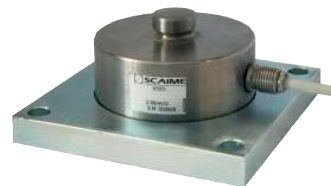
Kit plaque de montage - Plates mounting kit