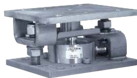
Kit de montage SILOKITR - SILOKITR mounting kit