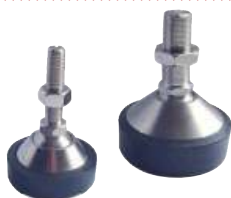
Pied - Foot LFC